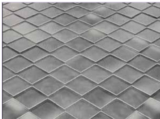
Esempio di simil lose in gres ceramico (tipo "Ardogres")