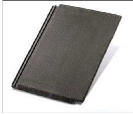
Esempio di simil lose in cemento (tipo "Tegal")

In ogni caso l'intervento sul materiale di copertura dovrà essere sottoposto al parere delle Commissione Igienico Edilizia che ne valuterà la compatibilità edilizio-architettonica rispetto al contesto edificato.