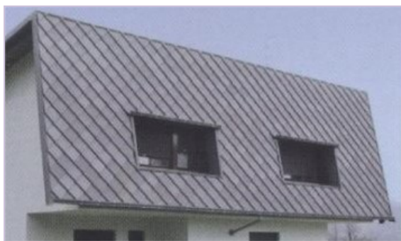
Tetto in zinco titanio