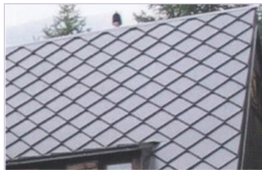
Tetto in alluminio preverniciato